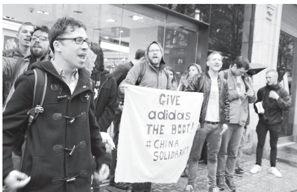
Vyjádření solidarity se stávkujícími čínskými dělníky.

7 Přepočteno podle kurzu ČNB ke dni 22. 4. 2016: 1 € = 27,045Kč.