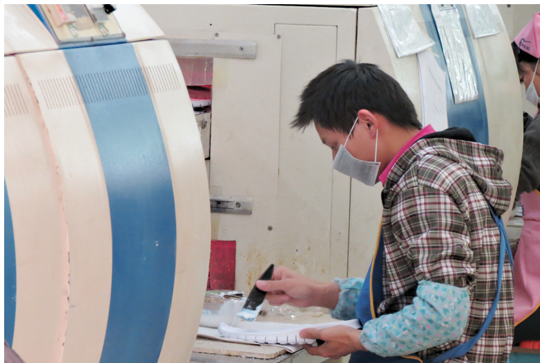
Zdravotní problémy dělníků v obuvnickém průmyslu často souvisí s používáním nebezpečných chemikálií a s nedostatečností ochranného oblečení a pomůcek.