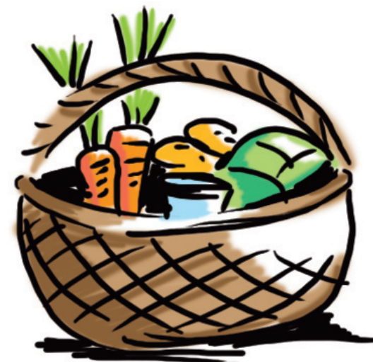
zelenina z trhu