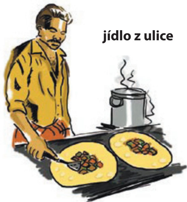
jídlo z ulice