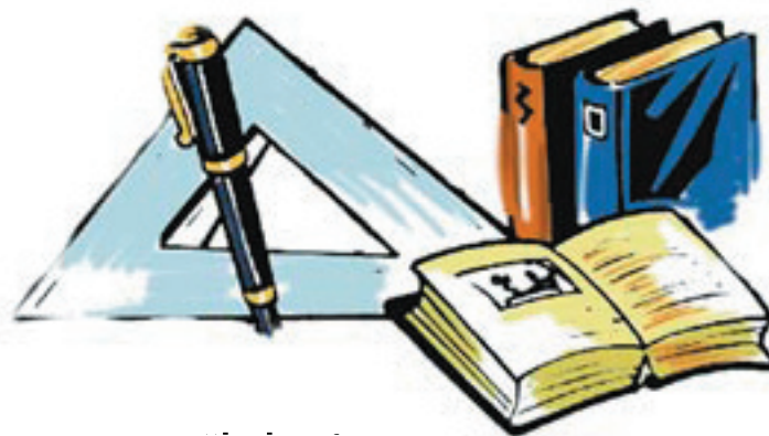
vesnická jednotřídka/1 dítě