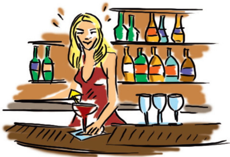
luxusní hotelový bar