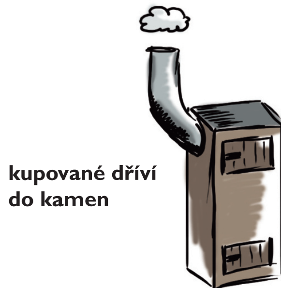
kupované dříví do kamen