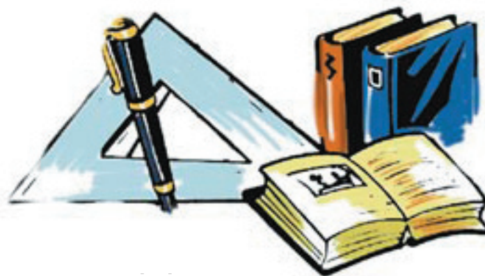
škola ve Fair Trade družstvu/1 dítě