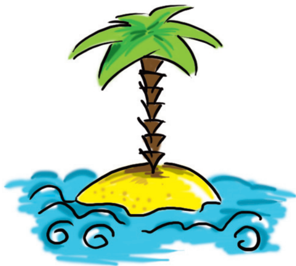
dovolená na Floridě