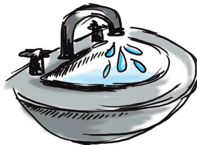
voda zavedená do domu