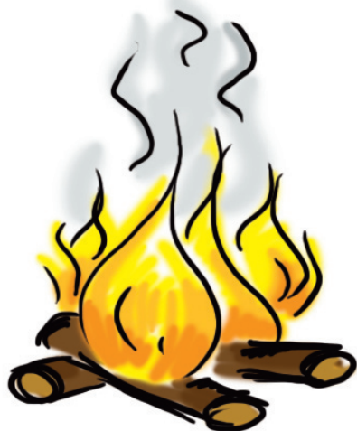
sbírané dříví na oheň