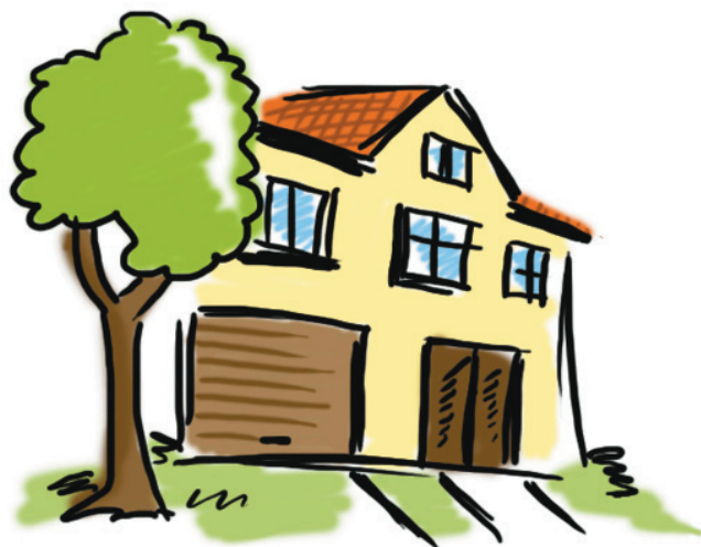
malý dům ve městě