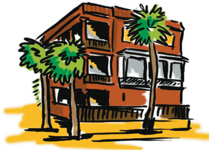
velký dům ve městě