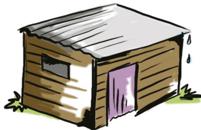
malý dřevěný domek