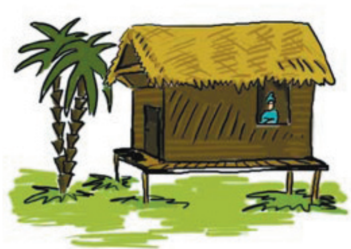
dvoupokojový dřevěný domek