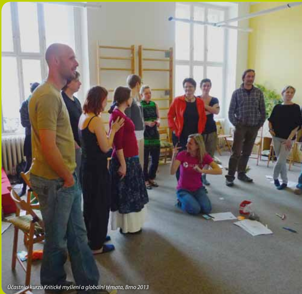
Účastníci kurzu Kritické myšlení a globální témata, Brno 2013