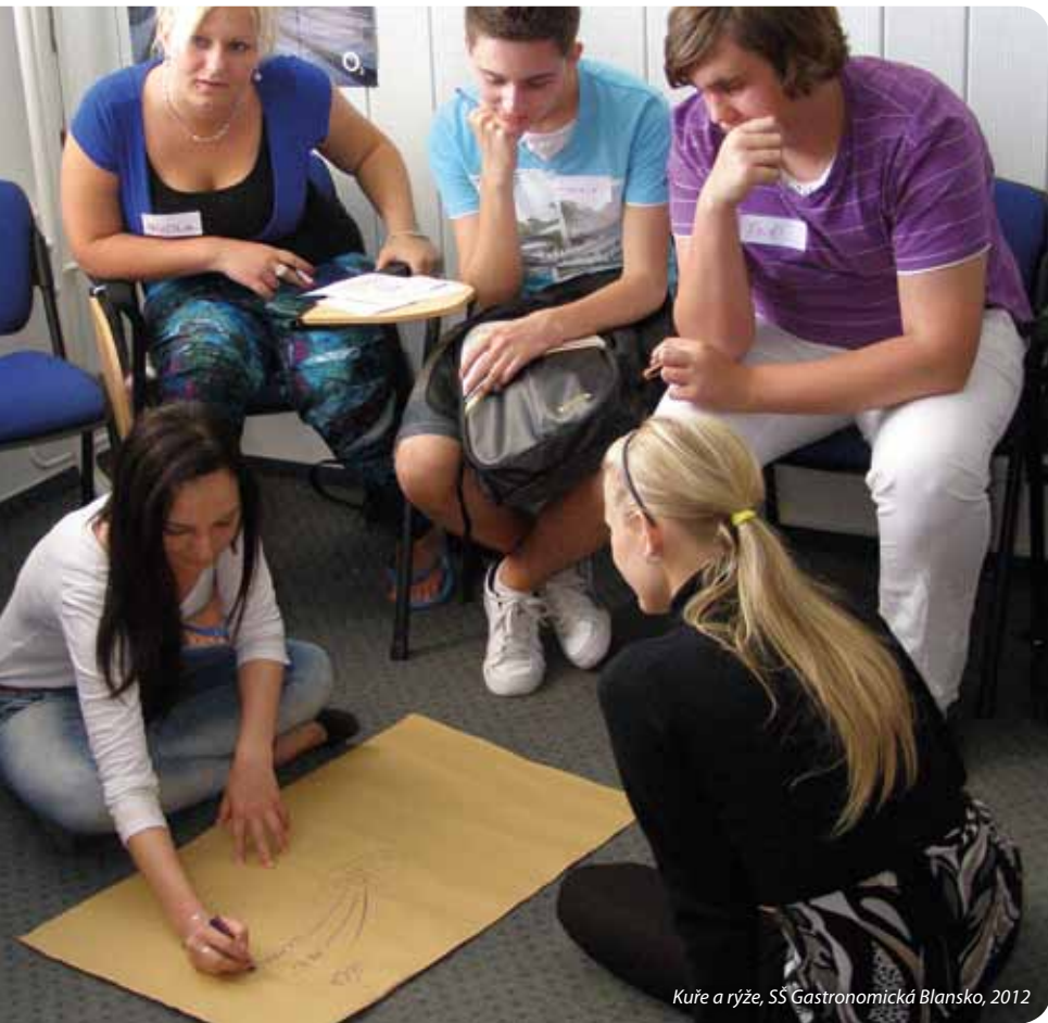
Kuře a rýže, SŠ Gastronomická Blansko, 2012