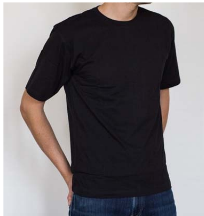
Černé pánské tričko