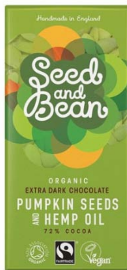
S&B s dýňovými semínky a konopným olejem