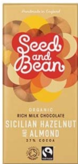
S&B s lískovými oříšky a mandlemi