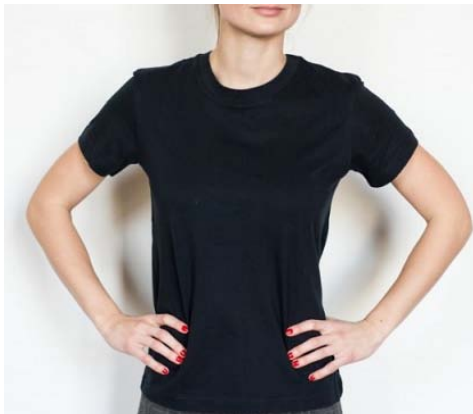
Černé dámské tričko