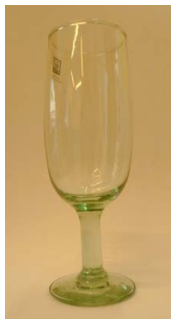
Sklenice na šampaňské

Slunečných dnů přibývá, teplých večerů také. Poseďte si na zahradě nebo v parku na dece. Připravte si okurkovou limonádu nebo nabídněte víno přátelům. Rozlévejte do skla z bolivijského fairtradového družstva. Jedná se o ručně vyrobené sklenice z recyklovaného skla, za něž výrobci dostali spravedlivě zapláceno.