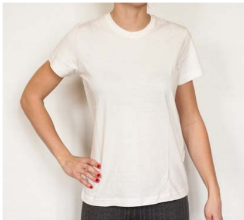
Bílé dámské tričko