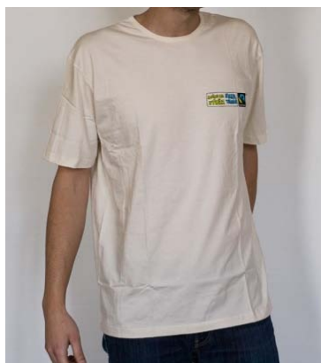
Bílé pánské tričko

Nabízená férová trička pořídíte nyní se slevou.